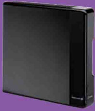
Version à montage mural